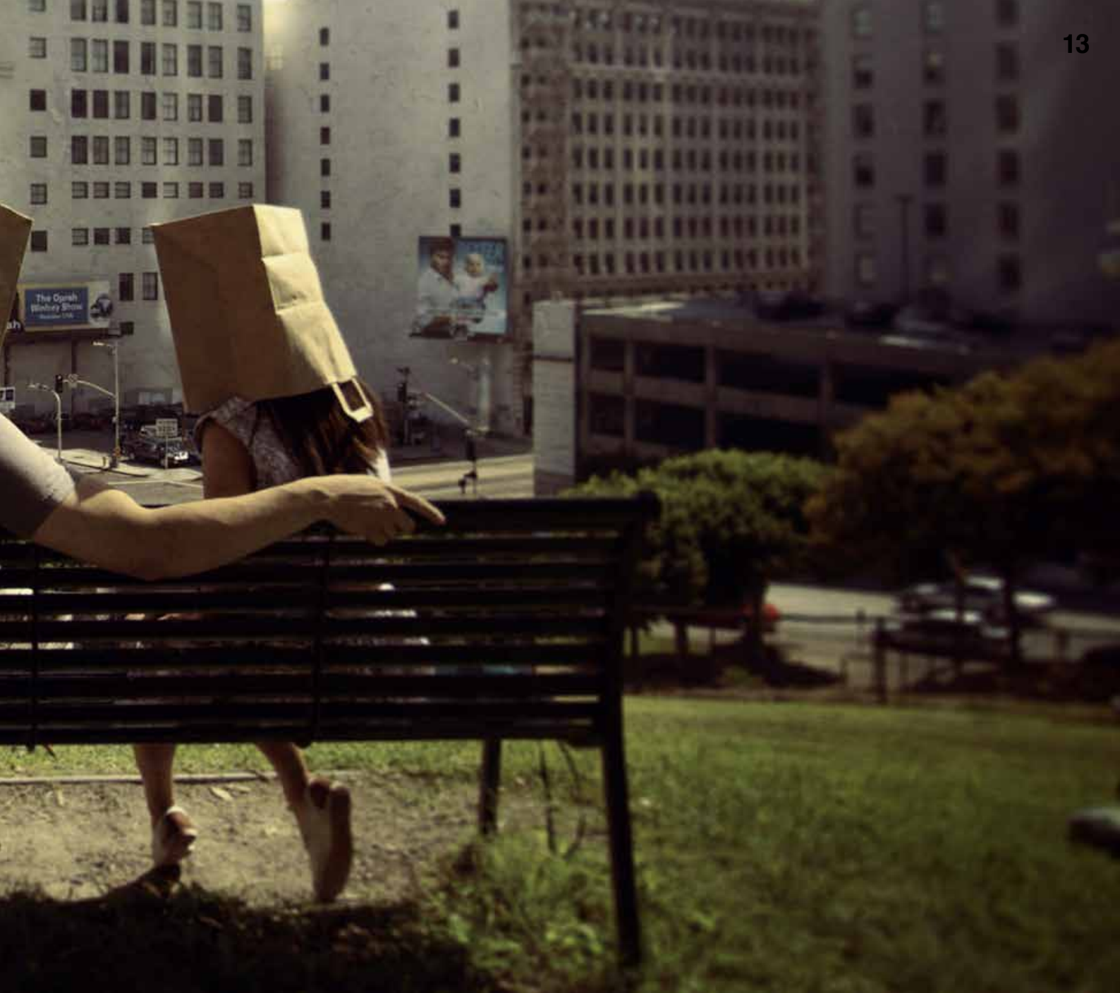
Jeffrey McDonald "The Storm in Pictures" 2015 - Flagg